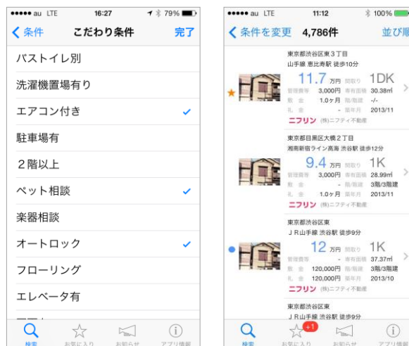
< iPhone 画面イメージ >

「賃貸物件検索」iOS版では、iCloud（注3）を使ってお気に入り登録した物件を複数デバイスで同期できるため、外出時の空いた時間にスマートフォンで検索をし、自宅ではタブレットやPCでゆっくり詳細を確認するなど、場所や時間に合った使い方が可能です（注4）。「@nifty 不動産」同様、エリアや沿線、こだわり条件などを細かく設定でき、最小限のタップで自分に合った物件を探すことができます。また、iOS 7に対応したシンプルで見やすいデザインを採用し、使い勝手にもこだわりました。