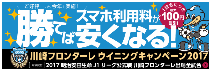
<「川崎フロンターレウイニングキャンペーン 2017」バナー>

また、「『スタジアムを青く染めろ！』限定デザインタオルマフラー プレゼントキャンペーン」では、「NifMo」「@nifty でんき」「@nifty 光」のいずれかを申し込みのうえ条件を満たした方に、もれなく川崎フロンターレの 2017 シーズンキャッチフレーズ「Paint it Blue」を織り込んだニフティ限定デザインのタオルマフラーをプレゼントします。さらに、「@nifty でんき」を申し込みのうえ条件を満たした方の中から抽選で 10 組 20 名様に、等々力競技場ボックスシート席の観戦チケットをプレゼントします。