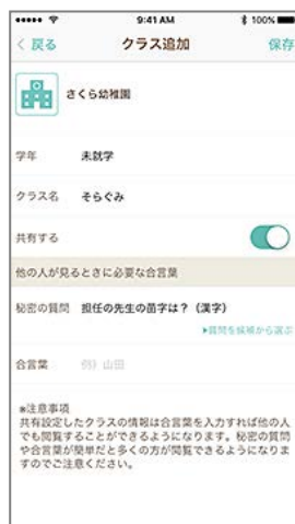
<グループ追加画面>

※グループの作成や、撮影したおたよりの共有、フォローには、無料のアカウント登録が必要です。グループのフォロー時には合言葉の入力が必要です。