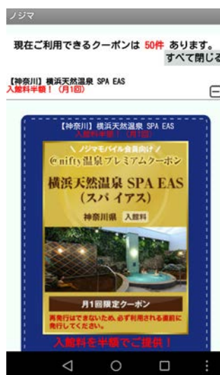
<クーポンイメージ>

ニフティは、温浴施設とその利用者をつなぐことを目指す、温浴施設情報専門サイト「@nifty 温泉」の運営を通じて、施設と利用者双方に役立つサービスの提供を進めてきました。今回、神奈川県を中心に、地域に根差した店舗運営を行うノジマと共同で本サービスを提供することで、お客様にお得に温浴施設を楽しんでもらうとともに、地域の温浴施設の活性化に寄与したいと考えています。